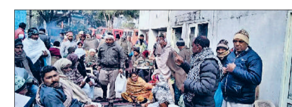
नारायणगढ़। मीटिंग के दौरान मौजूद कर्मचारी।