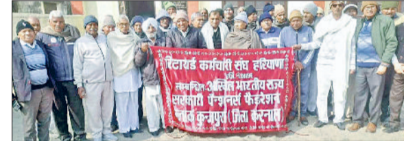
करनाल। प्रदर्शन करते हुए रिटायर्ड कर्मचारी।