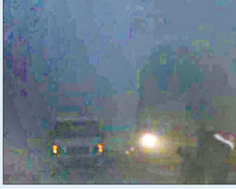
यमुनानगर। वीरवार को जिले में घने कोहरे में लाइट जलाकर चलते वाहन।

मौसम में लगातार बढ़ रही हाइड गलाने वाली टेंड में जिले के तापमान में भी गिरावट जारी है। वीरवार को जिले का अधिकतम तापमान 16 डिग्री सेल्सियस व न्यूनतम 6 डिग्री सेल्सियस दर्ज किया गया।