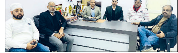
पानीपत। गेम्स ऑफ मास्टर्स एसोसिएशन के पदाधिकारी बैठक करते हुए।