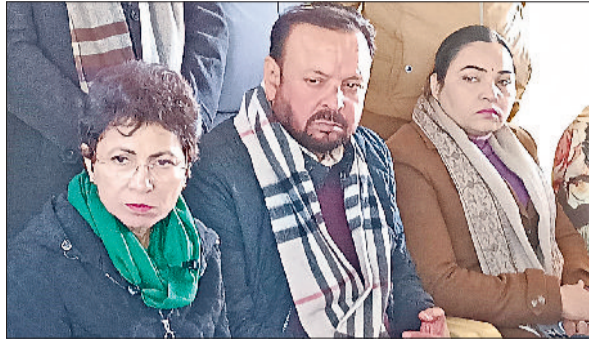
अंबाला। मीडिया से बातचीत करती सांसद कुमारी सैलजा।

हरिभूमि न्यूज ▶ अंबाला अखिल भारतीय कांग्रेस कमेटी की महासचिव एवं सिरसा लोकसभा से सांसद कुमारी सैलजा ने कहा कि भाजपा सरकार मनरेगा को कमजोर करने का काम कर रही है। उन्होंने कहा कि जब से भाजपा सत्ता में आई तब से मनरेगा योजना के तहत गरीब व जरूरतमंद लोगों को न तो 100 दिन का रोजगार मिल रहा है न ही योजना के दूसरे लाभ मिल रहे हैं। उन्होंने कहा कि कांग्रेस की युपीए सरकार ने मनरेगा योजना को इस तरह से लागू किया था कि ताकि गरीबों के सौ दिन के रोजगार की