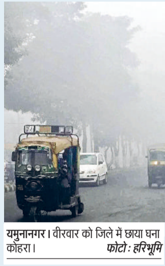
यमुनानगर। वीरवार को जिले में छाया घना कोहरा।

वीरवार को भी अल सुबह से जिला घने कोहरे की सफेद चादर में लिपटा रहा और शीतलहर चलने से लोग घरों में दुबके रहे। वीरवार तड़के तीन बजे से ही जिले में घने कोहरे का प्रकोप शुरू हो गया था और शीतलहर चलने लगी थी। दोपहर साढ़े बारह बजे के करीब घना कोहरा तो कुछ छंट गया। मगर दिन भर आसमान में धुंध के बादल छाए रहे और सूर्यदेव के दर्शन नहीं हुए। आसमान में छाए घने बादलों व शीतलहर चलने से लोग घरों में दुबके रहे।